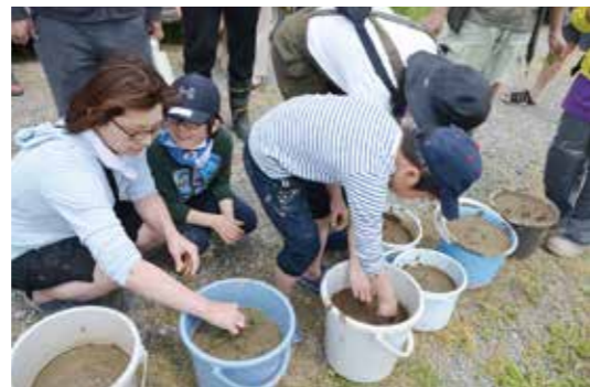
▲10月のバケツ苗品評会まで大事に育ててください。

次回は、6月10日に除草作業・生き物調査が行われる予定です。参加してみたいという方がいらっしゃいましたら、営農販売部 生産指導係までご連絡ください。