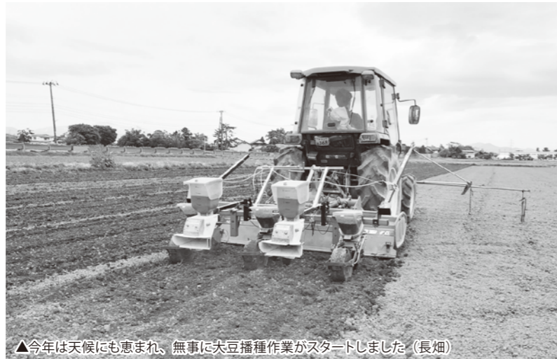
▲今年は天候にも恵まれ、無事に大豆播種作業がスタートしました（長畑）