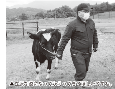
▲立派な姿になってかえってきてほしいですね。

鶴岡市羽黒の月山高原牧場で5月16日に和牛、5月23日に乳牛の入牧式が行われ、令和5年度の放牧事業がスタートしました。庄内全域から和牛、乳牛合わせて134頭が放牧され、当農協管内からも乳牛3頭が放牧されました。 6月から毎月行われる繁殖検診等で、牛の生育状況や受胎状況を確証し、放牧を行うことで畜産農家の飼養管理の負担が軽減される目的もあります。 10月下旬の下牧まで、栄養たっぷりの牧草を食べながら、足腰を鍛え、元気な姿で帰ってきてほしいですね。