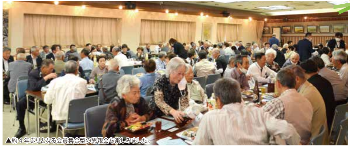
▲約4年ぶりとなる会員集合型の懇親会を楽しみました。