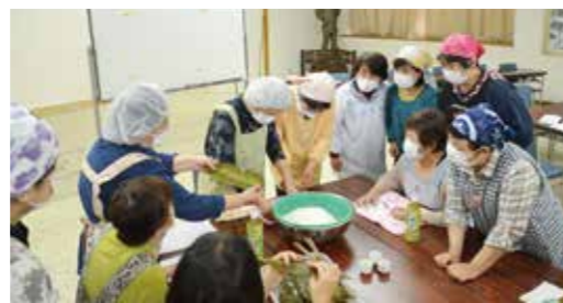
▲ばーむさんの皆様から丁寧な説明を受けました。

5月30日、当農協生活センターホールでJAあまるめ女性部が笹巻づくり講習会を開催し、部員18名が参加しました。ばーむさんの皆様が講師としてお招きし、笹の巻き方や紐の結び方などの説明を受け、笹巻作りに励みました。女性部員からは、「巻き方がうまくいかず、もち米がはみ出てしまう。」「紐の結び方が難しい。」など、最初は苦戦していましたが、個数を重ねるごとに慣れた手つきになりました。