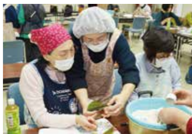
▲マンツーマンで笹巻作りを教えることもできました。

なり、格好がいい笹巻が多く見受けられました。講習会終了後には、女性部員から「巻き方を忘れた前に、もう一度講習会を行いたい。」「出来上がった笹巻を食べるのが楽しみだ。」との声も聞こえてきました。