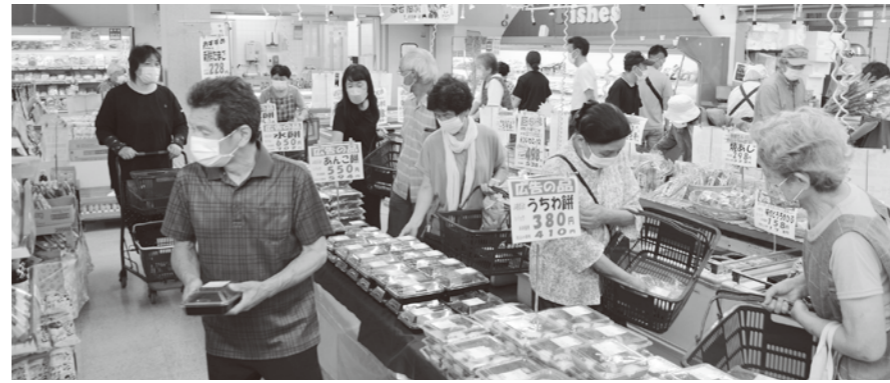
▲生活館お盆セール大盛況でした! PayPay キャンペーン期間中もご利用お待ちしております。

今年度も、庄内町のお買い物でPayPayを使用するとPayPayポイントが最大15%戻ってくるキャンペーンが9月1日~10月31日までの期間で開催されます。当農協では生活館・資材館・スタンド・農機・自動車でもご利用できます。昨年は6月に最大20%相当戻ってくるキャン