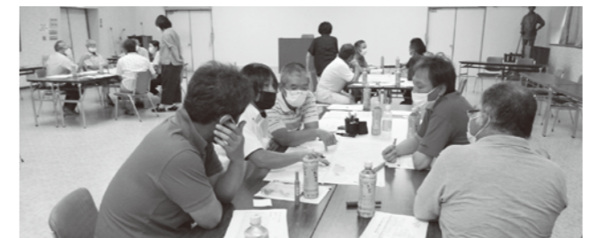
▲持続可能な地域農業の実現に向けて活発な意見交換となりました。

8月17日、当農協生活センターホールで庄内町生産組合連絡協議会会員研修が行われました。持続可能な地域農業の実現について、地域ごとにグループ討議を行い、その地域の課題や強みなど活発な意見交換がなされました。また、農地の集約や新規就農者の確保・育成についても話し合いが行われました。