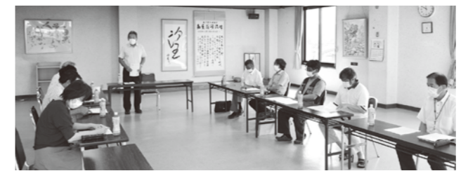
▲水田の賃借料、人・農地プランについて話し合われました。