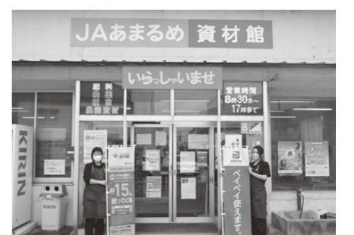
▲資材館では、9月18日(日)・10月16日(日)と第3日曜イベント開催予定です。ぜひPayPayご利用ください!