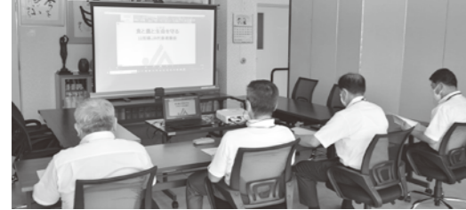
▲今年度もWEBでの参加となりました。