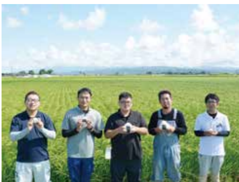
▲生協広報用に当農協のお米を使用したおにぎりを 持って写真撮影しました！