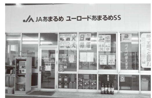
▲スタンド・農機・自動車も PayPay ご利用できます。