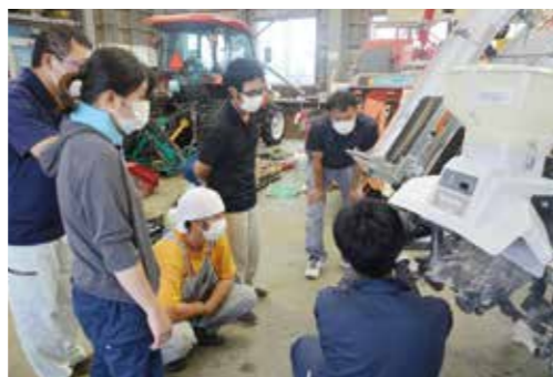
▲農業機械係職員より説明を受ける青年部員

8月15日、当農協の農機自然部で青年部員に向けての農機具講習会を行いました。各々持参してきた農機具を用いて、農業機械係の職員より、急な農機具不良が起った場合の対策など説明を受けました。オイル交換やこまめな整備点検の大切さなど改めて学ぶことができました。