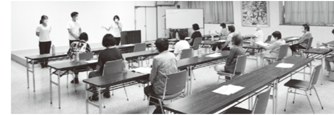
▲ドコモショップ余目店の講師の方からスマホの説明を聞きました。