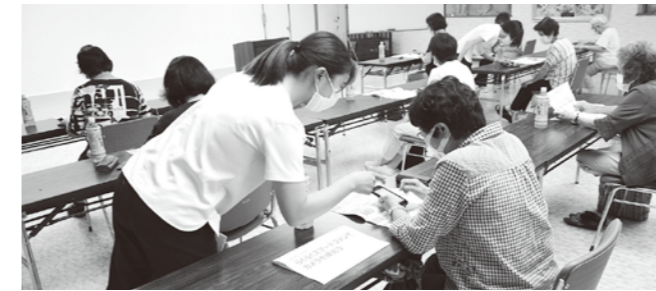
▲マンツーマンでスマホの使い方を教えてもらうことができました。