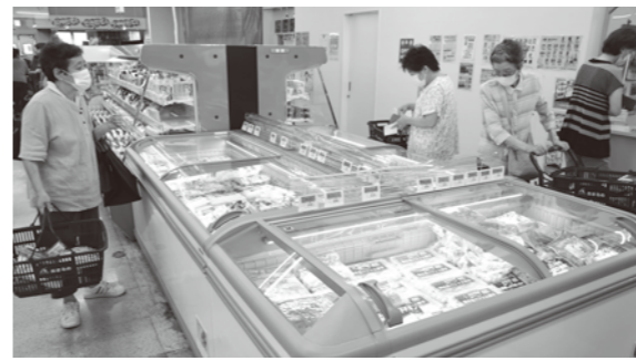
▲生活館では7月末より冷凍食品売り場を拡大しました。ぜひご利用ください! 時短調理に使えるカット野菜など準備しております。

今年度も、庄内町のお買い物でPayPayを使用するとPayPayポイントが最大15%戻ってくるキャンペーンが9月1日~10月31日までの期間で開催されます。当農協では生活館・資材館・スタンド・農機・自動車でもご利用できます。昨年は6月に最大20%相当戻ってくるキャン