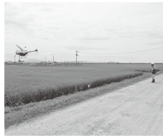
▲カメムシ対策のためへり防除を実施。

8月上旬からへり防除が行われ、水稲は約1,080鈴(カメムシ、紋枯病)、大豆は約160鈴(マメシ、クイガ、紫斑病)が散布されました。昨年度からカメムシの被害を更に減らすため、水稲には2回散布を行いました。天候不良により大豆のへり防除は心配されましたが、順調に作業を進めることができました。 水稲の生育状況は、平年並みとのことですが、これから不安定な天候状況が続くと予想され、例年より若干稲刈りの時期が遅れる可能性があります。農作業事故には十分留意しながら気をつけて行っていきましよう。 9月7日(水)には農協役員の歩刈りを予定しています。