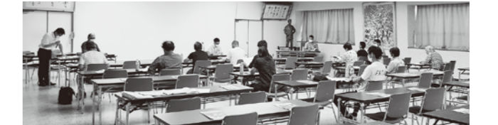
▲中央会より講師を招いてインボイス制度の研修を行いました。

インボイスとは、一定の記載要件を満たす請求書のことを言い、令和5年10月1日以降に行われる取引分から、適格請求書等保存方式(通称インボイス制度)が導入されます。