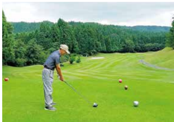
▲きれいなフォームを心がけ慎重に狙いました。